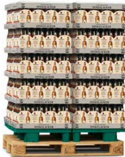
4x ¼ -Chep-Palette auf Europaletten Artikel-Nr.: 80016