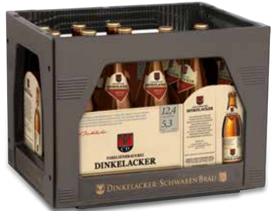
3x6x0,5l Kasten, Artikel-Nr.: 80064