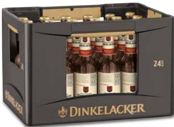
24x0,33l Kasten, Artikel-Nr.: 5045