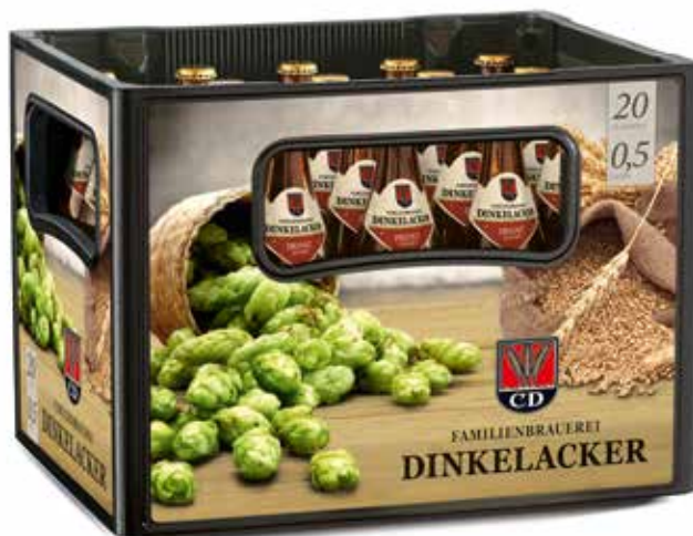
20x0,5l Kasten, Artikel-Nr.: 5001