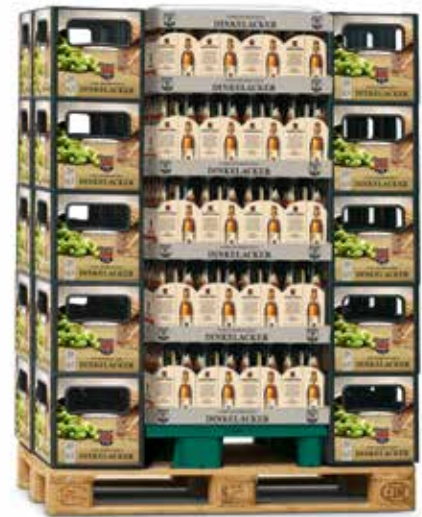
2x ¼ -Chep-Palette 20 leere Kisten Artikel-Nr.: 80017