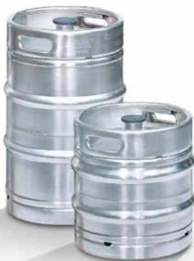
30l Keg-Fass, Artikel-Nr.: 5204