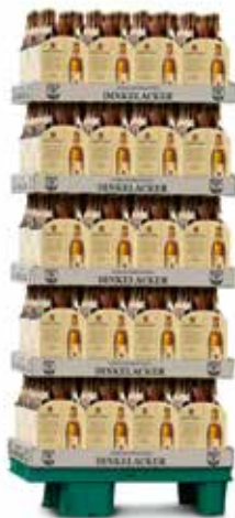
¼ -Chep-Palette als Verkaufsdisplay