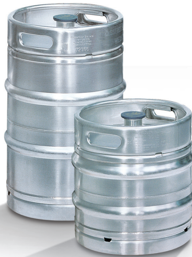
30l Keg-Fass, Artikel-Nr.: 5204