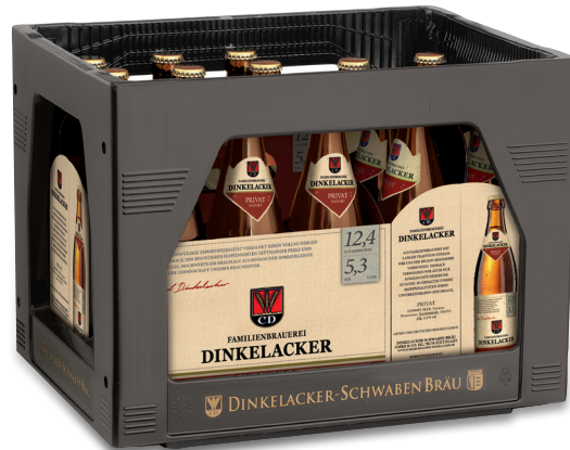
3x6x0,5l Kasten, Artikel-Nr.: 80064