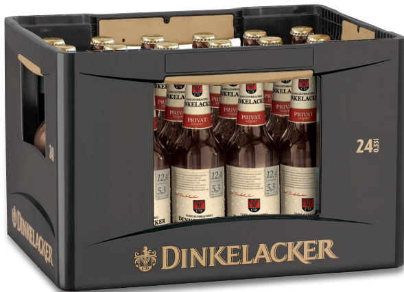
24x0,33l Kasten, Artikel-Nr.: 5045