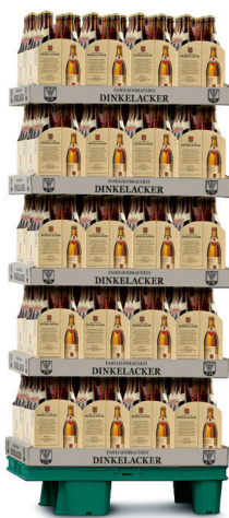
1/4-Chep-Palette als Verkaufsdisplay