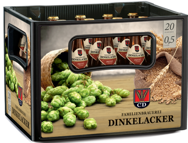
20x0,5l Kasten, Artikel-Nr.: 5001