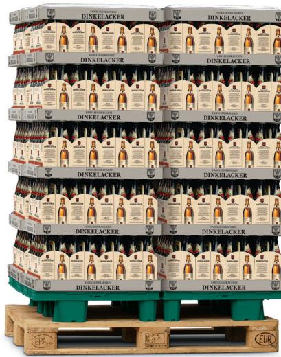
4 x 1/4-Chep-Palette auf Europaletten Artikel-Nr.: 80016