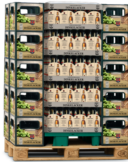
2 x 1/4-Chep-Palette 20 leere Kisten Artikel-Nr.: 80017